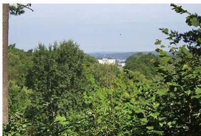
Från naturreservatet Prinskullen är det fin utsikt över Stjersunds slott och Hammars kyrka. Här satt enligt traditionen prins Gustaf och fick inspiration till sina dikter och sin musik. Kullen har fått sitt namn från detta.