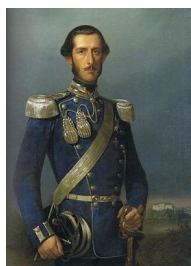
Prins August (1831-1873)