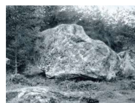
”Den norra” Bocksmostenen

Utdrag ur dikten Ensamhetens tankar (Vallfart och Vandringsår, 1888)