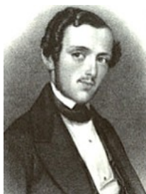
Prins Gustaf (1827-1842)

Prins Gustaf var förtjust i Stjersund och troligt är att han tänkte göra det till sitt varaktiga hem. Tyvärr så hann han inte att tillbringa så mycket tid där för han dog väldigt ung, endast 25 år gammal. Gustaf blev känd som "diktarprinsen" och "sångarprinsen". Han både sjöng och skrev dikter, och bland hans mest kända är sången "Sjung om studentens lyckliga dag". För att lyssna klicka på denna länk: (53) Sjung om studenternas lyckliga dar - YouTube