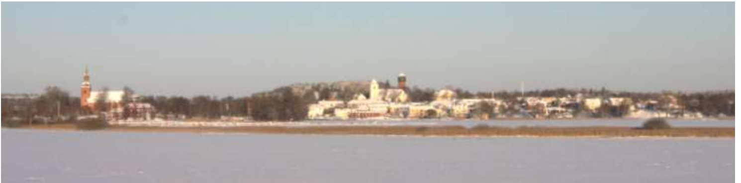
Askersund i vinterskrud. En vacker vy att vårda och hävda.