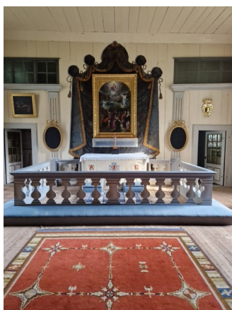
Boo Kyrka, byggd år 1698