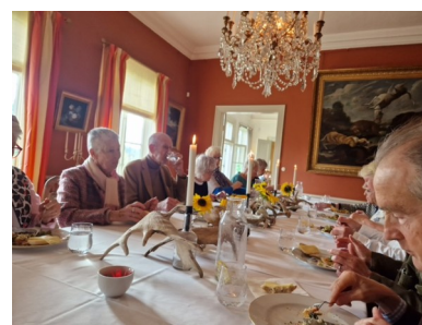
Gemensam lunch i matsalen, Boskulla

På Facebookgruppen finns cirka 10 min lång film från Iboholm, klicka här: