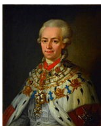
Johan Gabriel Oxenstierna Invald 1786, utträdde 1818