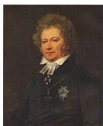
Esaias Tegnér Invald 1819, utträdde 1846