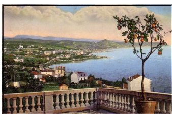
San Remo 1800-tal