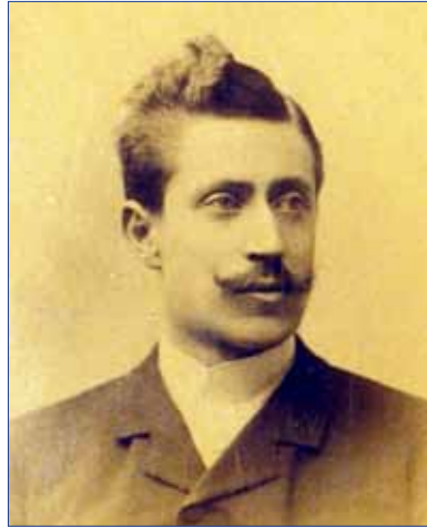
Författaren som ung.

Vi, som mötas några korta stunder, barn av samma jord och samma under, på vår levnads stormomflutna näs! Skulle kärlekslöst vi gå och kalla? Samma ensamhet oss väntar alla, samma sorgsna sus på gravens gräs.