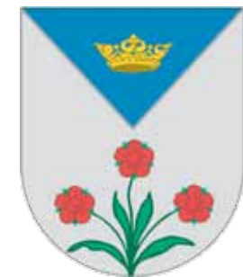
Sköld från Övralid.

Även med förbundna ögon och utan vetskap om var jag befunne mig skulle jag genast kunna skilja Vätterns vågskvalp från andra sjöars. Vågorna träffa stranden ojämnt och snabba och sjunka tillbaka utan rossling och suckan men med en hel yster liten melodi av kluckande eller sakta småsjungande ljud.