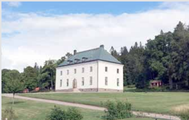
Övralid ligger högt och vackert vid Vätterns östra strand.

Full av optimism och framtidstro låter Heidenstam bygga Övralid år 1925. Från Övralid hade Heidenstam utsikt över Vättern. Där inrättar han sig och hoppas att inspirationen skall återkomma. Så sker dock inte, då han tidigt drabbades av sjukdom. Heidenstam avled 1940.